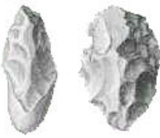
Rys. 2. Pięściaki

ostatecznie przesądza o tym, że dana struktura lub przedmiot nie powstały w wyniku przypadku, ale zostały zaprojektowane przez inteligentną istotę. Unikalny kształt lub regularność jeszcze o tym nie świadczą. Następnie profesor odniósł to rozumowanie do procesów zachodzących wewnątrz żywej komórki podczas powstawania cząsteczek protein. W celu lepszego zilustrowania tematu wyświetlony został fragment filmu „ Odkrywanie tajemnicy życia ” ( “Unlocking the Mystery of Life” ), przedstawiający komputerową animację wymienionego wyżej procesu. Nieopisana złożoność, precyzja i celowość procesu kopiowania kodu genetycznego, transportu cząsteczek i kompletowania białka z poszczególnych aminokwasów, niewątpliwie pozostawiły każdego z ważnym pytaniem: czy takie funkcje mogą być jedynie wynikiem przypadku? Niecodzienny wykład spotkał się z dużym zainteresowaniem (sala była przepelniona) zarówno studentów, jak i obecnego grona profesorskiego.